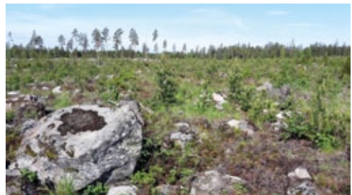
Kl. 08:55 på ett hygge