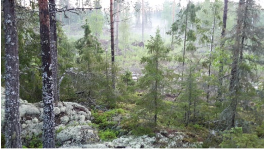
Kl. 04:14 längs linje 1, 05:08 och 05:41 någonstans mitt i skogen

Men det är också det som är tjuvsningen – jag ska ta mig ut till några platser som jag annars aldrig hade uppsökt. Det är inga utflyktsmål som lockar, inga vägar som leder dit, inget särskilt jag letar efter, ingen särskild fågel heller – mitt uppdrag lyder helt enkelt att räkna alla fåglar när jag går längs ruttens kantlinjer och på ruttens 8 punkter.