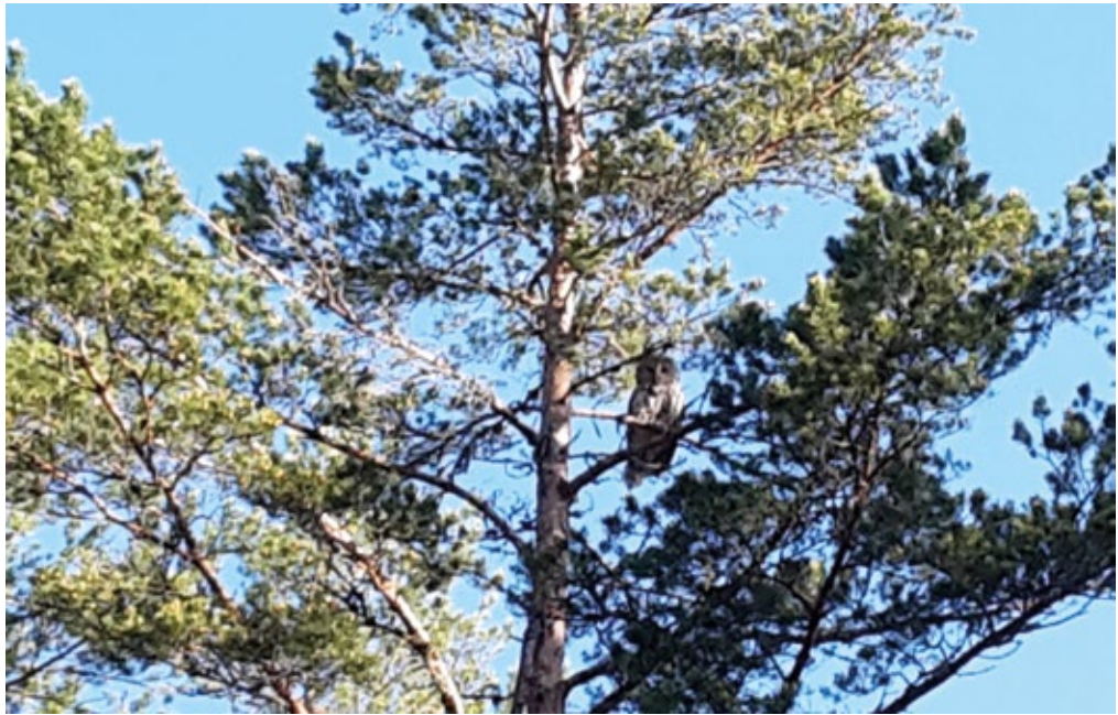
Kl. 07:15, slagugglan efter attacken

skymtar jag en torraka som mycket möjligt kan vara platsen för boet. Jag går raskt fram och förbi torrakan och ugglan. Nu verkar det som jag kommit förbi. Ugglan sitter uppe i ett träd och tittar på mig men gör inga fler anfall. Puh! Torrakan med boet råkade stå lite för nära min förbestämda linje. Kul att stöta på en slaguggla, men det kunde lätt ha gått illa. Jag har hört om halvt avrivna öron och klomärken i ansiktet. De som märker slaguggleungar utrustar sig med skyddshjälm! Men jag har haft tur. Ugglan träffade mig i nacken där luvan av min huvtröja skyddade min hals. Fick ett par lätta rivmärken bara. Nästa gång ska jag vara bättre förberedd!