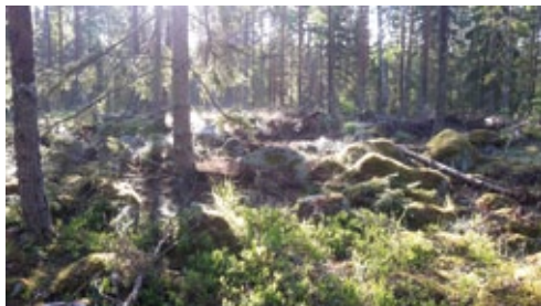
Kl. 06:58, paus med ångande moss

och under 5 minuter vid var och en av de 8 punkterna. Inte så svårt. Utmaningen består i att hitta i skogen, men GPS:en är en bra hjälp – pilen på skärmen visar om jag håller rätt kurs mot nästa punkt. Hur hade jag gjort för 20 år sedan? Ibland är det lätt att gå, genom gles skog, ibland blir det tätare. Det finns diken, och ett brett dike ställer till det. Det är alldeles för långt för att ta sig runt. Som tur är hittar jag flera nedfällna träd som korsar diket och vid en plats ligger två träd på ett sätt så att jag kan klättra på den ena och hålla fast i den andra. Så lyckas jag ta mig över diket med inte alltför stor omväg och jag letar mig tillbaka till min linje på vägen till punkt 3. Här är det fint. Solen börjar klättra upp bakom träden och spindelväv glittrar av daggen i motljuset. I en trädtopp sjunger en